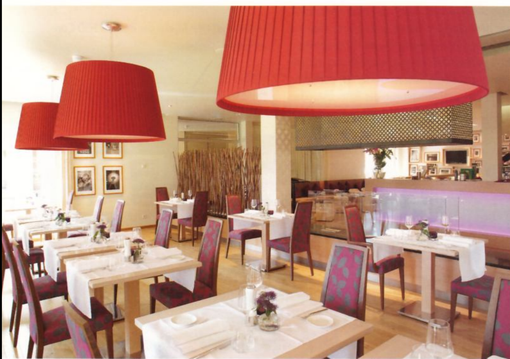
Das Restaurant kann neben dem normalen Betrieb auch für verschiedene Veranstaltungen genutzt werden.

Im Herbst soll der neue Kur- und Wellnessbereich mit medizinischer Betreuung, Massagen, Kosmetik und Sauna eröffnen. Auch ein Dermatologe mit eigenen Anwendungsräumen wird das Wellnessangebot erweitern. Gäste können dort vom Alltag abschalten und Kraft tanken. Das Besondere des Hotels wird dann ein integrierter Therapiebereich für Haut und Haar auf hohem medizinischen Niveau sein. Geplant wurde die Einrichtung für das Hotel des Gastronomie-Neueinsteigers Helmut Kollosche vom Innenarchitekturbüro Kaiserschönlein, das in Berlin und Hamburg ansässig ist, in Zusammenarbeit mit dem Komplettanbieter Voglauer Hotelconcept. Viel Wert wurde dabei vor allem auf ein natürliches Ambiente gelegt, in den Farbthemen Grün für die Pflanzen, Orange für