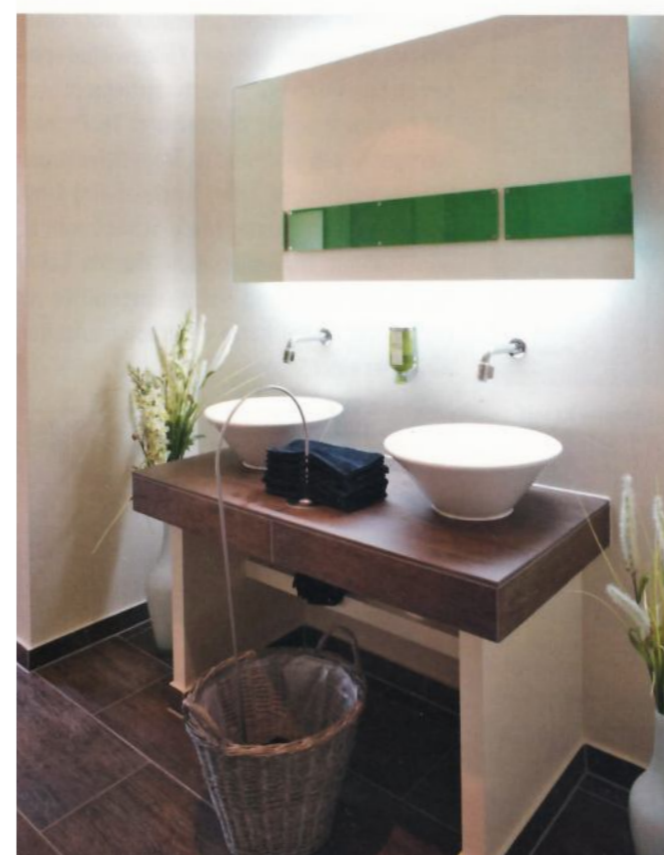
Überraschendes Detail im WC: So gehen Handtücher nicht verloren.