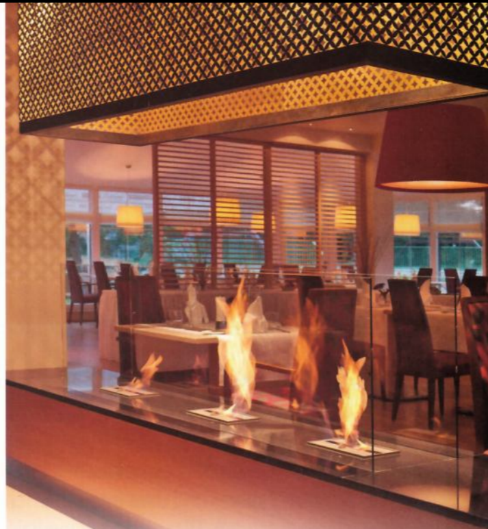
Feuer aus drei Bio-Ethanol-Kaminen unter einem großen beleuchteten Messing-Rauchfang schaffen im Restaurant „Konrads“ eine gemütliche Atmosphäre.

Wald und Wasser prägen die Landschaft rund um den kleinen Ort Burg. Für das neue „Kur- und Wellness Haus Spree Balance“ regte diese natürliche Umgebung zu einer besonderen Farbgestaltung der Zimmer an, die das elegante Interieur spannungsreich unterstreicht.