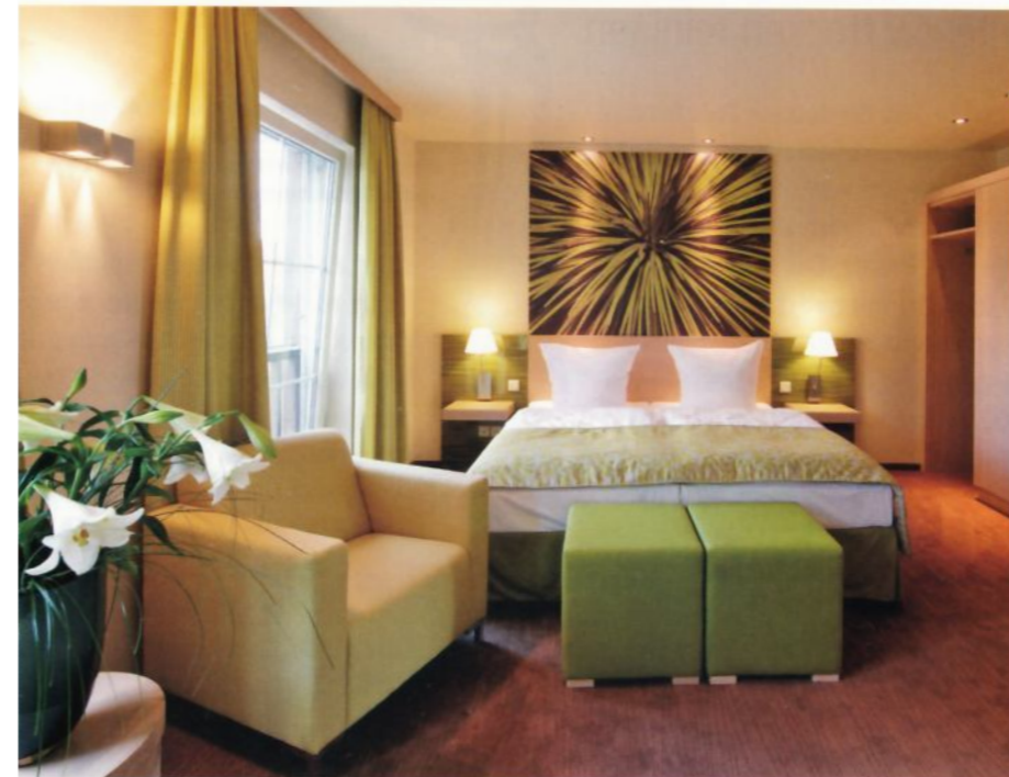
Die Zimmer sind in drei Farbthemen gefasst. Bildmotive über den Betten wurden speziell auf die verwendeten Materialien abgestimmt.

das Feuer und Beige für die Erde. Die Entwicklung eines Gesamtkonzeptes übernahm Voglauer und damit die Ausstattung der 25 Zimmer, des Restaurants „Konrads“ (benannt nach dem Küchenchef Konrad A. Wackerle), der Rezeption und der Lounge. Die vorwiegend verwendete helle Eiche vermittelt dabei den Charme einer modernen Rustikalität. Das Restaurant mit indirekter Beleuchtung und elegantem Mobiliar bietet in einem entspannten Ambiente bis zu 60 Personen Platz. Dem Farbthema Feuer wurde